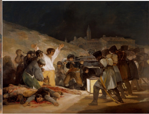
El tres de mayo de 1808

Como cualquier población, Cabrillas tampoco se salvó de que esto ocurriera.