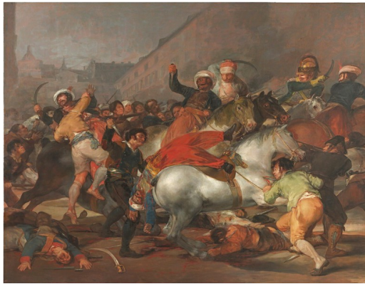
El dos de mayo de 1808

Los saqueos, violaciones y asesinatos de las tropas francesas llevaron al alzamiento del pueblo el 2 de mayo de 1808, retratado en los cuadros de Goya.