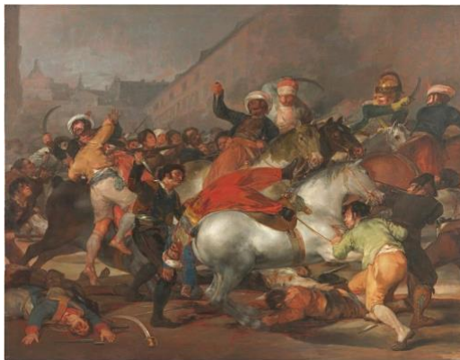
El dos de mayo de 1808

Los saqueos, violaciones y asesinatos de las tropas francesas llevaron al alzamiento del pueblo el 2 de mayo de 1808, retratado en los cuadros de Goya.