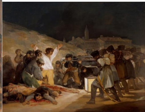
El tres de mayo de 1808

Como cualquier población, Cabrillas tampoco se salvó de que esto ocurriera.